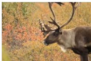
C. Le caribou

Bien que l'ours et le caribou sont tous les deux présents sur le territoire canadien, c'est le castor l'animal emblématique de notre pays. Il est devenu notre emblème le 24 mars 1975.