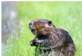
A. Le castor

Quel est l'animal emblématique du Canada ?