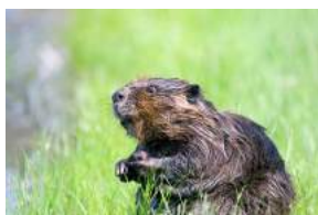
A. Le castor

Quel est l'animal emblématique du Canada ?