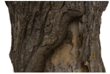
L'écorce d'un arbre