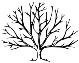
Un arbre feuillu (sans feuilles)