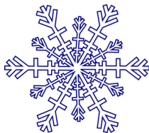
De la neige