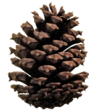
Une pomme de pin