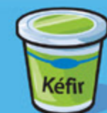
Kéfir 175 g (¾ tasse)