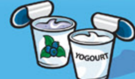
Yogourt 175 g (¾ tasse)