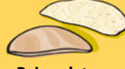
Pains plats ½ pita ou ½ tortilla (35 g)