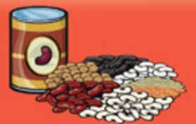
Légumineuses cuites 175 mL (¾ tasse)