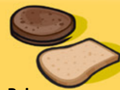
Pain 1 tranche (35 g)