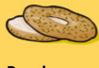
Bagel ½ bagel (45 g)