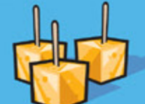
Fromage 50 g (1 ½ oz)