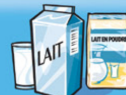
Lait ou lait en poudre (reconstitué) 250 mL (1 tasse)