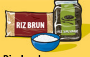
Riz, boulgour ou quinoa, cuit 125 mL (½ tasse)