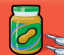
Beurre d'arachide ou de noix 30 mL (2 c. à table)