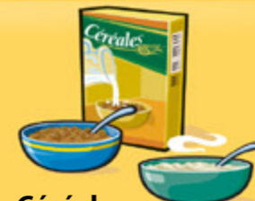
Céréales Froides : 30 g Chaudes : 175 mL (¾ tasse)