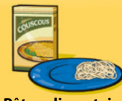
Pâtes alimentaires ou couscous, cuits 125 mL (½ tasse)