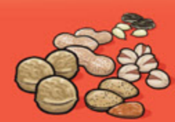
Noix et graines écalées 60 mL (¼ tasse)

Le tableau ci-dessus indique le nombre de portions du Guide alimentaire dont vous avez besoin chaque jour dans chacun des quatre groupes alimentaires.