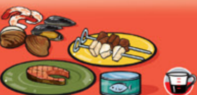
Poissons, fruits de mer, volailles et viandes maigres, cuits 75 g (2 ½ oz)/125 mL (½ tasse)